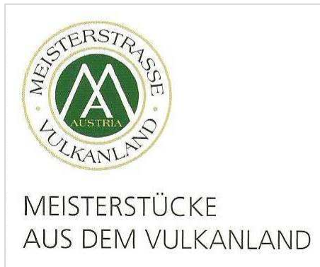
Abb. 2: Meisterstraße Vulkanland

„Meisterstraße Steiermark“ im Vulkanland, stellen so ihre Produkte in den Vordergrund und machen ihre Betriebe somit unverwechselbar.