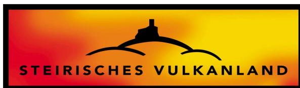
Abb. 4: Logo des Steirischen Vulkanlandes

„Wir suchten für diesen „Inwertsetzungsprozess“ einen neuen Identitätsträger und fanden in der bislang unbeachteten Vulkanlandschaft, die diese Region jahrmillionen Jahren [sic!] geprägt hat, durch die Thematisierung dieser Kulturlandschaft, einen besonderen Markenträger. Um den mentalen Wandel von der entwerteten Grenzregion in eine neue verheißungsvolle Zukunft zu ermöglichen, braucht es eine starke Identifizierung mit diesem Lebensraum und diese Identifizierung bringt eine neue Identität hervor, die nur durch einen gemeinsamen Identitätsträger in einer Marke gebündelt werden kann.“ 15