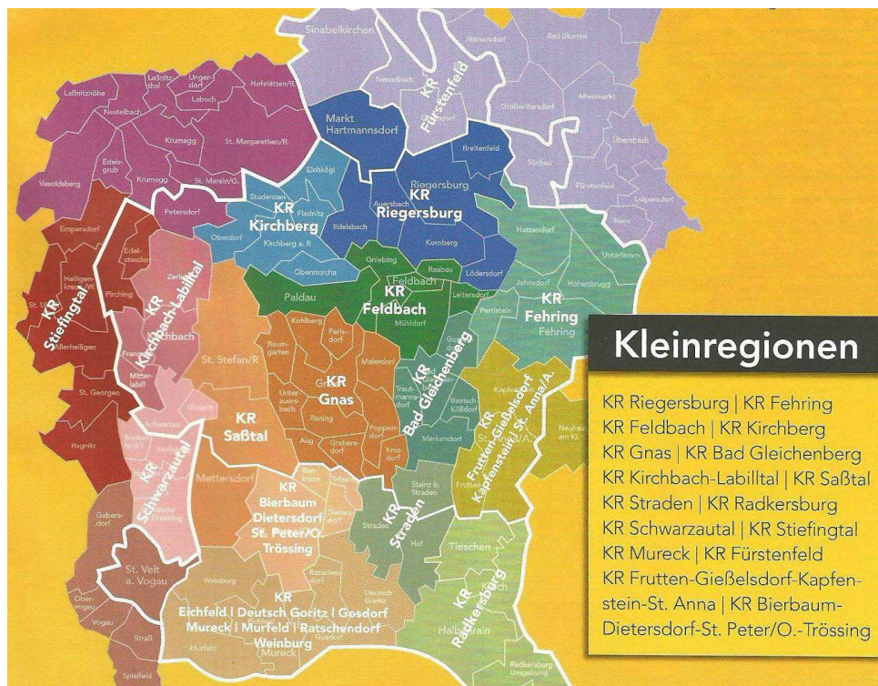
Abb. 1: Kleinregionen des Steirischen Vulkanlandes

Das Steirische Vulkanland besteht derzeit aus 79 Gemeinden aus den Bezirken Feldbach, Bad Radkersburg, Fürstenfeld und Weiz. Das Hauptanliegen ist es, die Wirtschaft und den Zusammenhalt der Grenzregion in sozialer, ökologischer und wirtschaftlicher Hinsicht zu stärken.