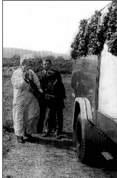
Tankwagenweihe anlässlich der Festfeier "10 Jahre Gemeinde Gniebing - Weissenbach".