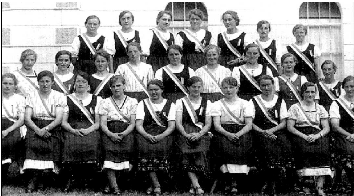
Feuerwehrfest in Gniebing 1935