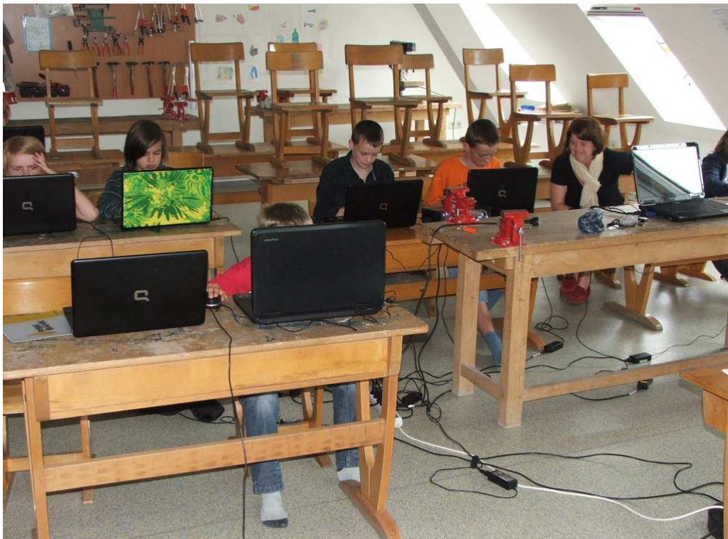
Unsere PC-Profis mit Ihrer Lehrerin bei der Arbeit