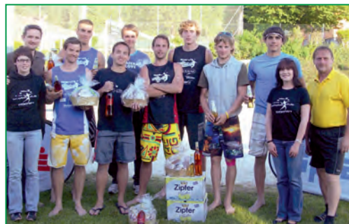
Die Sieger nach einem spannenden Turnier.