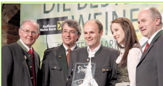
Weinhof Platzer wurde bei der Landesweinbewertung in Graz Landessieger mit dem ausgezeichneten Rotwein „Königsberg 2009“.