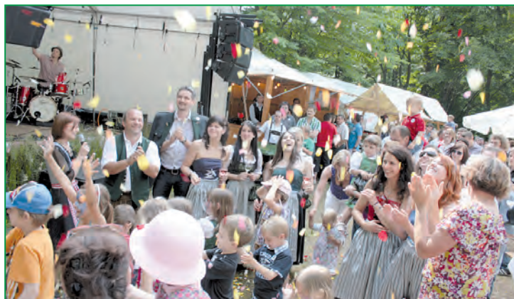
Viele Besucher genossen die herrliche Stimmung mit romantischem Ambiente.

bei heimischen Weinen und einer umfangreichen Kulinarik verwöhnt. Ein besonderer Programmhöhepunkt neben den Poppendorfern, The royal dance club und Betty O' & Band zauberten die Weinblüten mit einem richtigen Blütenregen und mit dem gemeinsam vinifizierten Rosé-Wein, genannt " die Rosi ", der die zauberhafte Atmosphäre dieser Naturkulisse perfekt abrundete.