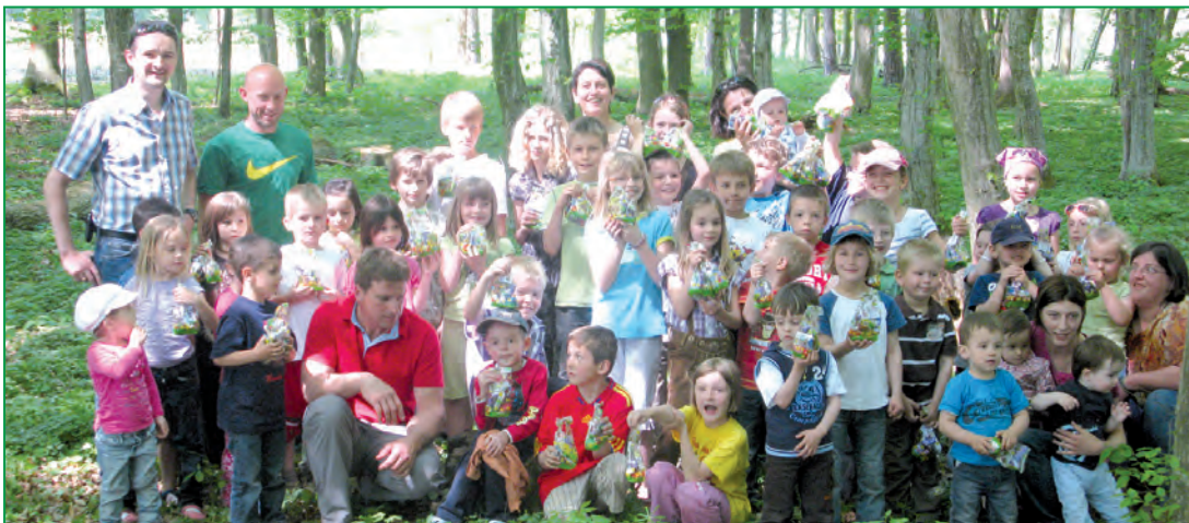
Am beliebten Ostereiersuchen nahmen wieder viele Kinder teil.