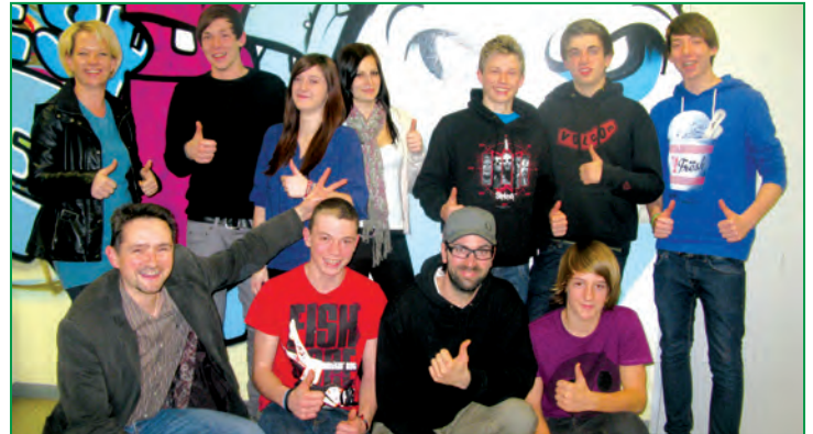
Der Jugendraum Chillout ist Treffpunkt zum Reden und Entspannen.