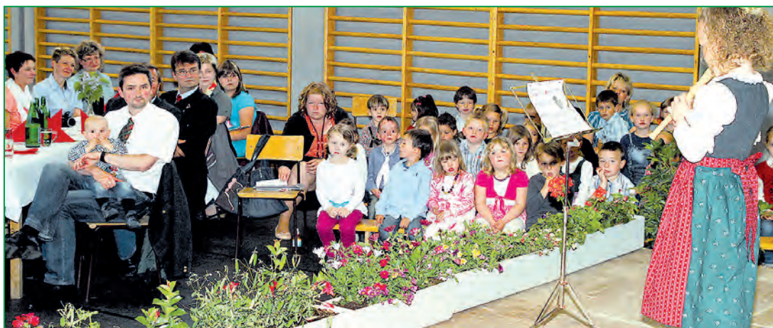
Die Kinder trugen ein liebevolles Programm für die Muttis und Omas vor.

Anlässlich des Muttertages lud die Marktgemeinde