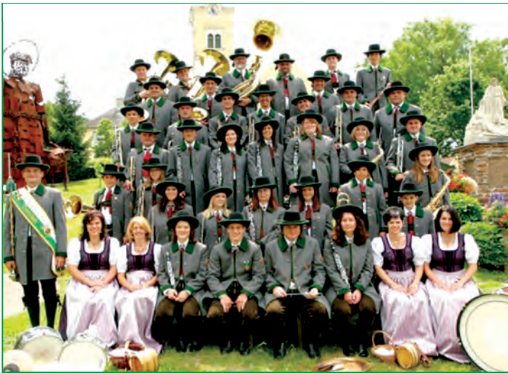
Anlässlich unserer neuen Tracht wurde heuer wieder ein neues Gruppenfoto vom Musikverein Tieschen erstellt.