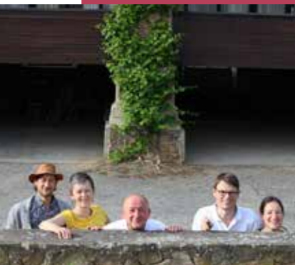
Weingut Ploder - Rosenberg