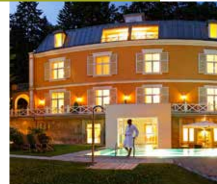
Gerti und Reinhard Kaufersch

Die Villa ist schon eine störrische Dame. Wenn sie lauscht, wenn Leute fragen, was das besondere an unserem Hotel ist, wird sie immer ganz grantig. Drum sagen wir meistens gar nix und lassen die sprechen, die es am besten wissen. Unsere Gäste.