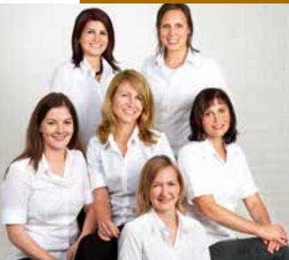
Team Neuroth Hörberatung