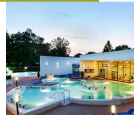
Parktherme Bad Radkersburg

Wieder wie neugeboren fühlt man sich in der Parktherme Bad Radkersburg. Im Mittelpunkt steht das einzigartige Thermalwasser, das aus eigener Kraft aus zwei Kilometern Tiefe mit 80 °C höchst mineralstoffreich an die Erdoberfläche kommt. Besonders spürbar ist die gesundheitsfördernde und entspannende Wirkung der Thermalquelle im Quellbecken mit 36 °C. Im Vita med Gesundheitszentrum der Parktherme sorgen medizinisch ausgebildete Therapeuten mit vielfältigen Massagen und Pflegeanwendungen für das persönliche Wohlbefinden. Regionale und saisonale Produkte stehen im Mittelpunkt der Kulinarik in der Parktherme. Heiße Auszeiten sind im Saunadorf erlebbar, wo harmonisierende oder prickelnd-aktivierende Erlebnisaufgüsse mit Düften, Cremen oder Crushed-Ice alle Lebensgeister wecken.