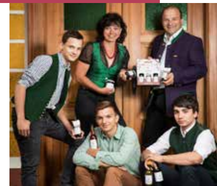
Familie Gangl Biohof, Hofladen

KobatL kommt aus dem Volksmund. Der „Koh“ ist ein lebender Zaun, eine Hecke, die früher meist Grenzen markierten. Der „Bartl“ - ein Naturgeist, ein Kenner des Natürlichen der im Koh lebt. KobatL steht für Naturstoffe, die das Leben aufbauen und erhalten. Und für eine nachhaltige Landschaftsnutzung. Unsere Produkte sind wahre, genussvolle und wertvolle Lebensmittel. Wir gehen neue Wege z.B. im Weinbau, bei der Safterstellung oder mit dem „Bitter-Vital“ - ein Mehrwertgetränk mit der Kraft unserer regionalen Pflanzenwelt auf Aroniabasis. Auch die wohltuenden Säfte der „DirndTrilogie“ sind reine Natur. KobatL-Magie des Lebens steht für all das Verborgene, dass die Gesundheit baut und die Vitalität fördert.