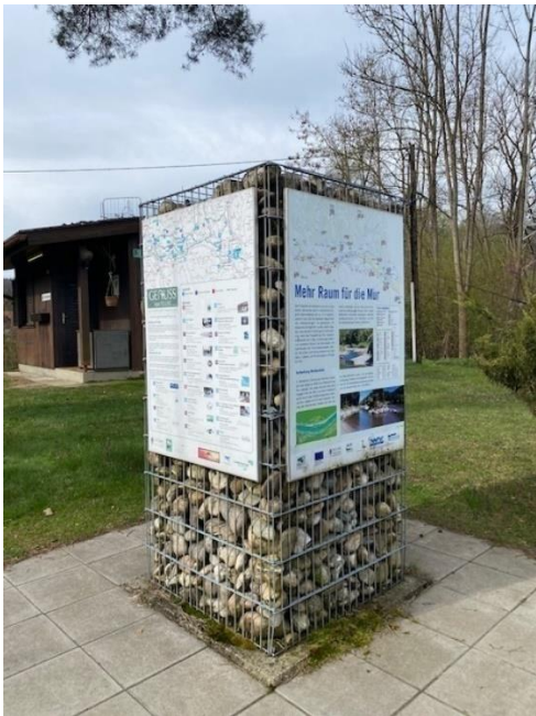
SchAUplatz im Biosphärenpark