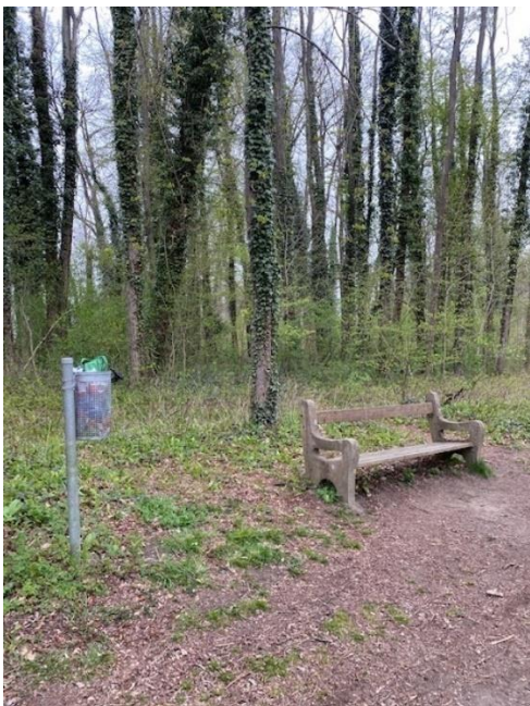
Bänke und Müllkübel entlang der Mur (leider überfüllt)