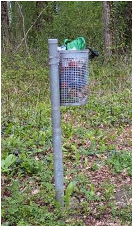
Abbildung 6: Überfüllter Müllkübel

Im BSP sind bereits einige Abfallbehälter vorhanden, vor allem im Bereich der Schiffsmühle. Trotzdem konnte festgestellt werden, dass es noch von der Biberzentrale (Liebmannsee) bis nach Bad Radkersburg an Abfallbehältern mangelt und viele Abfallbehälter rund um die Schiffsmühle überfüllt sind. Diese minimalen Verschmutzungen durch den herumliegenden Müll wirken sich negativ auf das Landschaftsbild aus. Die Müllsituation ist keinesfalls alarmierend, jedoch sind dennoch Verbesserungsmaßnahmen erforderlich.