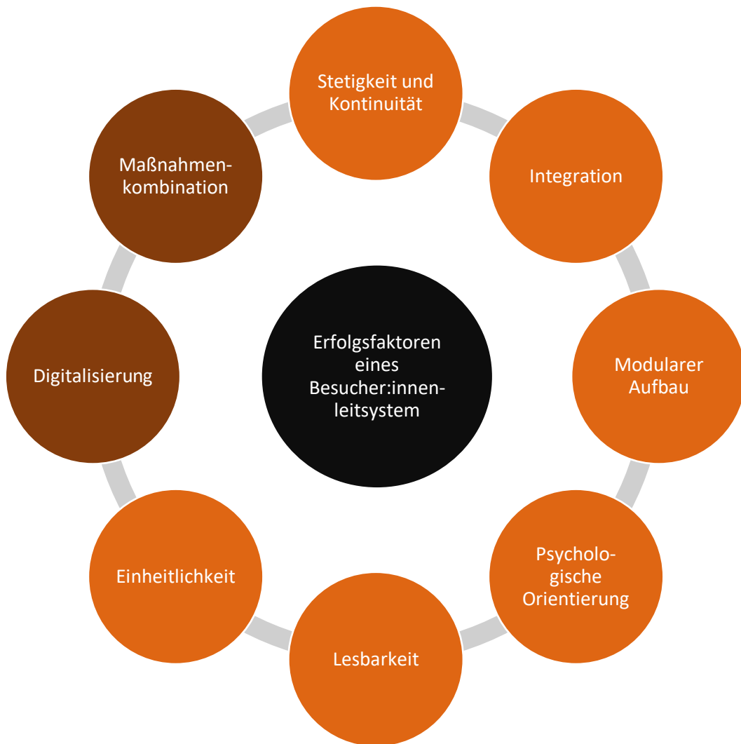
Abbildung 2: Erweiterte Erfolgsfaktoren eines Besucher:innenleitsystems