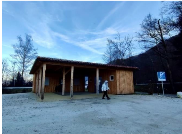
Abbildung 5: Container mit Sanitäreinrichtung, Müllplatz und Infostand