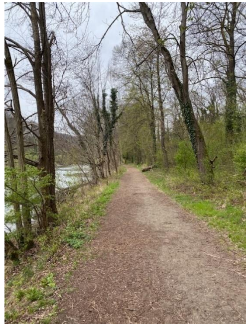
Wanderweg entlang der Mur (Höhe Schiffsmühle)