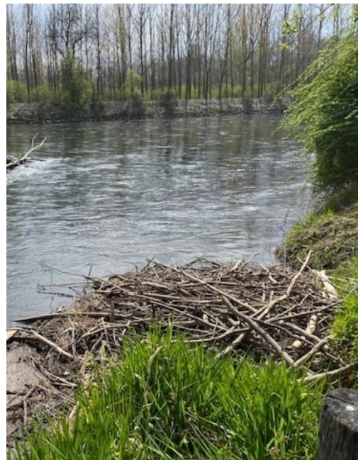
Biberbau bei der Biberzentrale