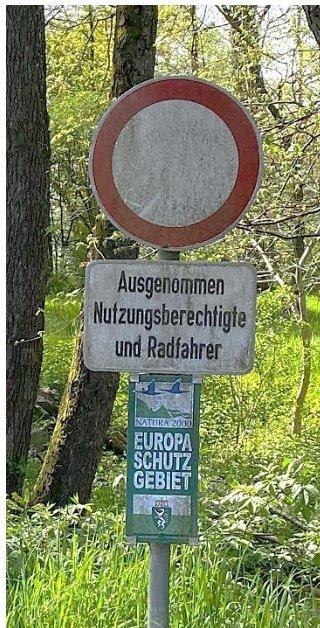
Abbildung 8: Fahrverbotstafeln mit Zusatzinfo "ausgenommen Radfahrer"

Darüber hinaus sind bereits Fahrverbotsschilder im BSP vorhanden. Diese Fahrverbotsschilder werden jedoch von Radfahrer:innen häufig nicht beachtet. Ein Grund dafür könnte die unterschiedliche Darstellung der Fahrverbotsschilder sein. Einige Fahrverbotsschilder sind sogenannte „allgemeine Fahrverbotsschilder“, die auch für Radfahrer:innen gelten, während andere Verbotsschilder die Zusatzbezeichnung „ausgenommen Radfahrer:innen“ tragen (siehe Abbildungen unten). Dies könnte zu Verwirrung bei den Radfahrer:innen führen.