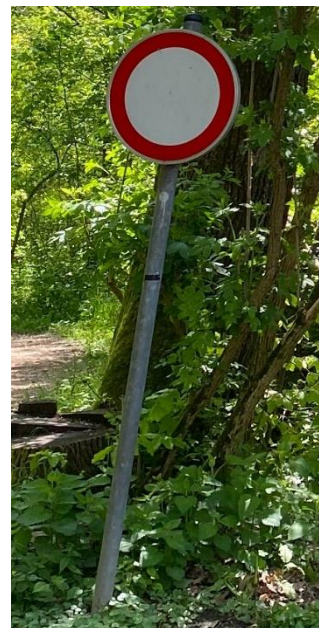
Abbildung 9: Allgemeine Fahrverbotstafel