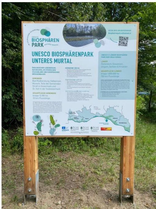
Abbildung 10: Neue Informationstafel im BSP

Bei den QR-Codes stellte sich im Zuge einer Besichtigung der neu aufgestellten Schilder heraus, dass es beim Laden der Website über die QR-Codes zu Schwierigkeiten kommen kann. Grund dafür ist das schwache Mobilfunknetz in der Nähe der Staatsgrenze. Hier sollte gemeinsam mit den Mobilfunkanbietern nach Lösungen gesucht werden.