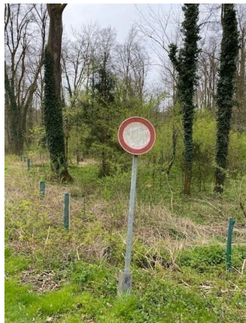
Fahrverbotstafel am Weganfang