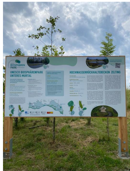
Abbildung 11: Neue Informationstafel im BSP