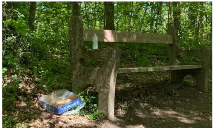
Abbildung 7: Müll neben einer Parkbank